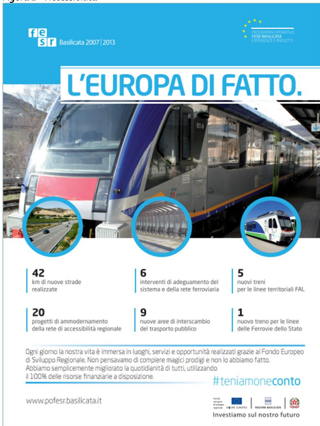
Figura 2 – Accessibilità